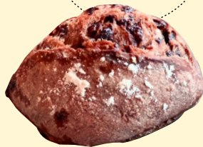
ミニチョコ フランス