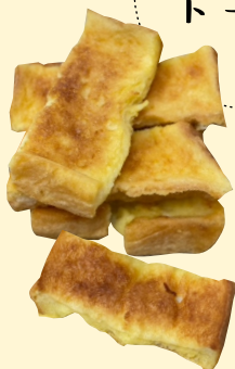
フレンチ トースト