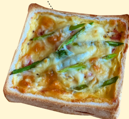
春の食パン キッシュ