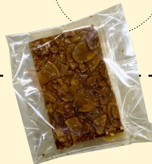
ハニー フロランタン