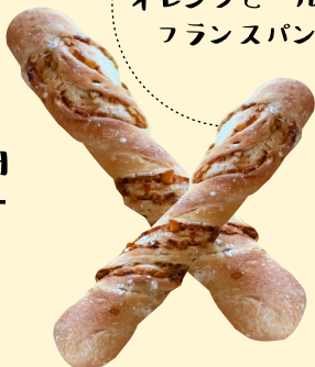
くろみと オレンジピールの フランスパン